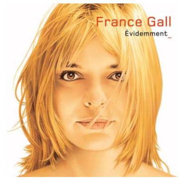
France Gall Évidemment_